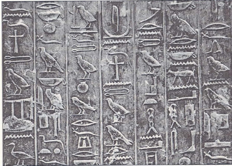
चित्र क्र.१ : इजिप्त हायरोग्लिफिक अक्षरे

असलेल्या सिंधू संस्कृतीत सुमेरियन संस्कृतीमध्ये शिलालेखांविषयीही हायरोग्लिफिक हाच शब्द वापरला जात असे. या लिपीत मुख्यतः चित्रमय स्वरूप असल्यामुळे सध्या अस्तित्वात असलेल्या कोणत्याही प्रकारच्या लेखन पद्धतीत यांचा वापर होत नाही. काही विशिष्ट राजघराण्यातील लोकांनी स्वतःचे अस्तित्व टिकविण्यासाठी किंवा काही विशेष घटनांची किंवा युद्धांची नोंद ठेवण्याच्या आशयातून अशा प्रकारच्या चित्रांचे कोरीव काम करून ठेवले होते. तसेच माणसांनीही स्वतःची ओळख निर्माण करण्यासाठी या चित्रलिपीचा वापर केला. हायरोग्लिफिक लिपीतील चिन्हांचा संबंध धार्मिक समजांशी फार जवळचा आहे असे लक्षात येते. मृत व्यक्तींच्या थडग्यांवर (ग्रेवयार्डवर) काही नकारात्मक किंवा धोकादर्शक चिन्हे कोरली जात असत. यामध्ये काही व्यक्ती आणि विंचू व साप असे धोकादायक प्राणी यांची चित्रे असत. याउलट काही चिन्हांना सकारात्मक दृष्टीने सुध्दा वापरले जात होते. यामध्ये देव, राजा, विविध ठिकाणे इत्यादींचा समावेश होता. उदा. 'देवाचा सेवक' असा शब्द लिहावयाचा असल्यास प्रथम देव शब्दाचे चिन्ह आणि नंतर सेवक अशा पद्धतीने लिहिले जात असे. ही लिपी समजू शकणारी काही ठरावीक माणसे सर्व कालखंडांमध्ये होती. इजिप्तमध्ये लिखाणाच्या अभिजात काळात या