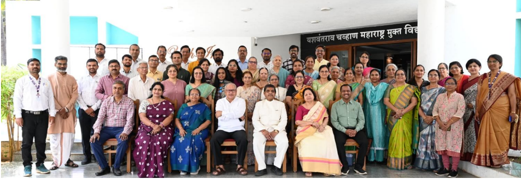
२७, २८ मार्च २०२६ रोजी आयोजित "अध्ययन साहित्य लेखन कार्यशाळेत सहभागी