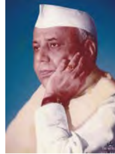
स्व. यशवंतरावजी चव्हाण को सादर समर्पित