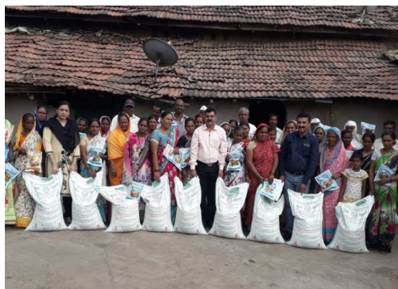
Left : Group discussion among the farmers in village, Bahadurwadi Tal. Chandwad Right : Critical inputs seed of Digvijay at Bahadurwadi Tal. Chandwad