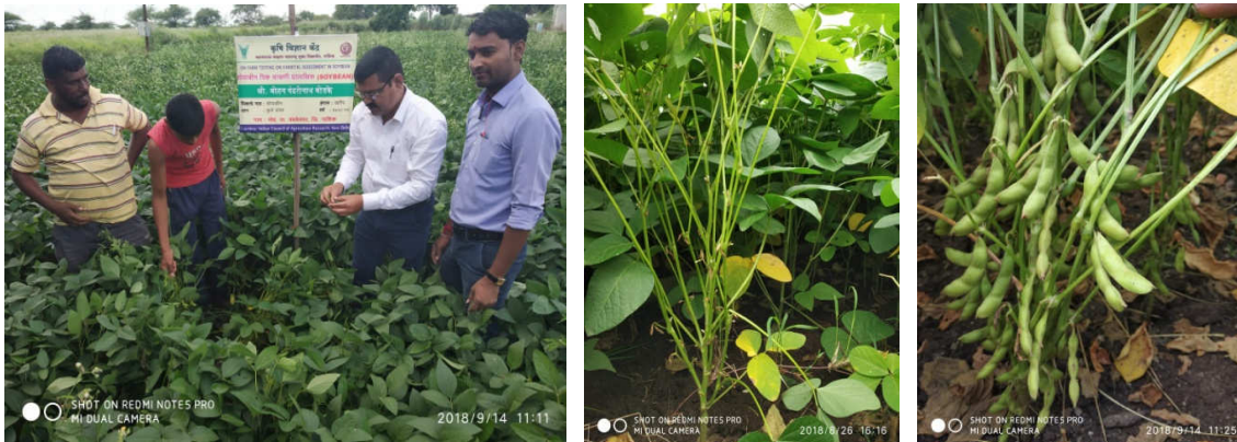
Left : Monitoring OFT Soybean plots of Phule Sangam by the scientists at Moh, Tal. Sinnar Right : Flowering and pod development stage of OFT Soybean at Moh, Tal. Sinnar