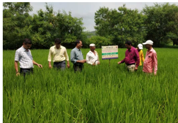
Left : Training programme conducted on OFT Paddy var. Phule Samruddhi at Chirapali Right : Monitoring OFT Paddy plots by the scientists at Chirapali, Tal. Trymbakeshwar