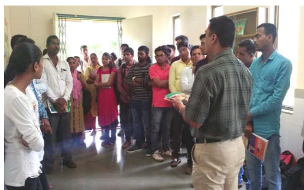
Left : Training on INM Paddy at Jategaon (Bk), Traymbakeshwar Right : Training on Soil and Water testing for Rural Youth at KVK campus