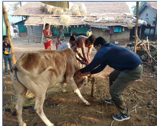
Left : Vaccination to animals for FMD disease in tribal areas