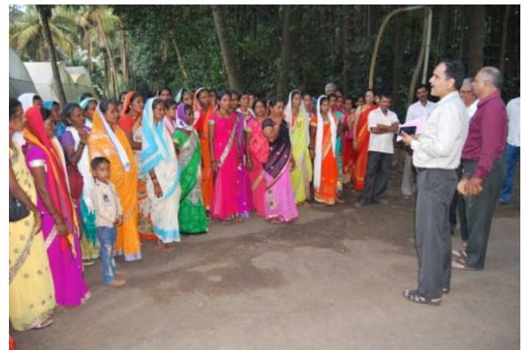
Left : Training on Dry land Fruit Plantation Under TSP to tribal Farmers of Surgana Right :Tribal women farmers Visit to KVK Farm