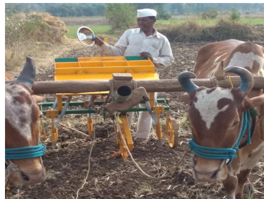
FLD on Multicrop planter for wheat & proposed for employment generation through custom hiring services for marginal & small farmers at village chirapali Tal. Trimbakeshwar