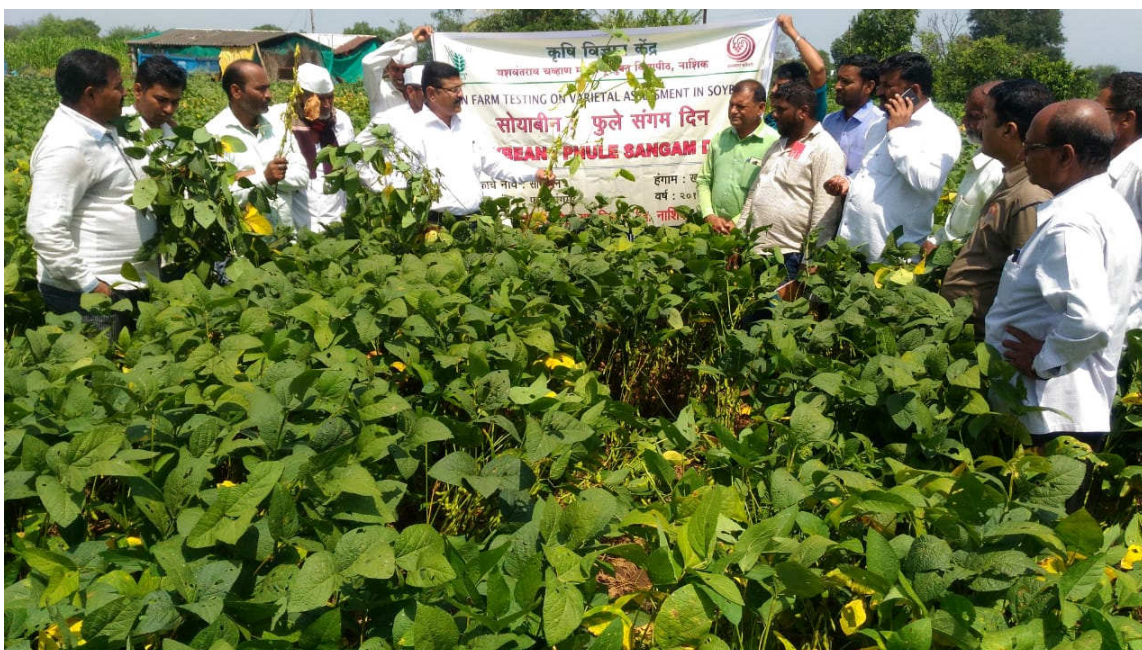
Celebration of field day on Soybean OFT variety Phule Sangam at Moh, Tal. Sinnar