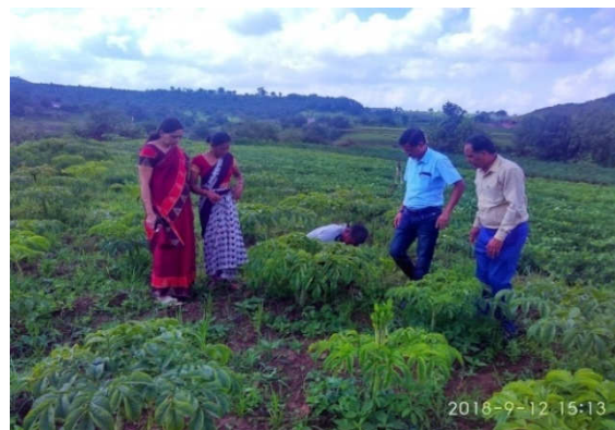
Left :OFT On Elephan Yam (Suran) Field Day at Village Chakore Tal- Traymbakeshawar Right :OFT On Elephan Yam (Suran) at Village Chakore Tal- Traymbakeshawar