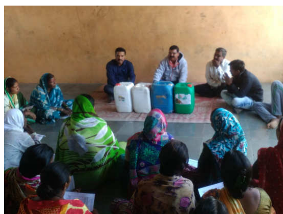
Left : Training on chickpea production technology in village, Bahadurwadi Tal. Chandwad Right : Metarhizium anisopliae & Trichoderma for IPM in village Bahadurwadi Tal. Chandwad