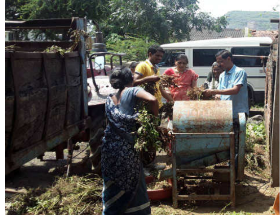
Left : Demonstration Custom hiring services Farmers club member vertical conveyor reaper in the cluster villages, Chirapailli Tal trimbakeshwar