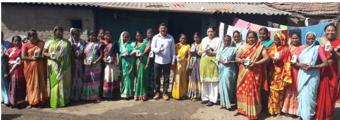
Neem based insecticides for controlling Helicoverpa sp. for chickpea CFLD plots by scientists in village, Bahadurwadi T. Chandwad