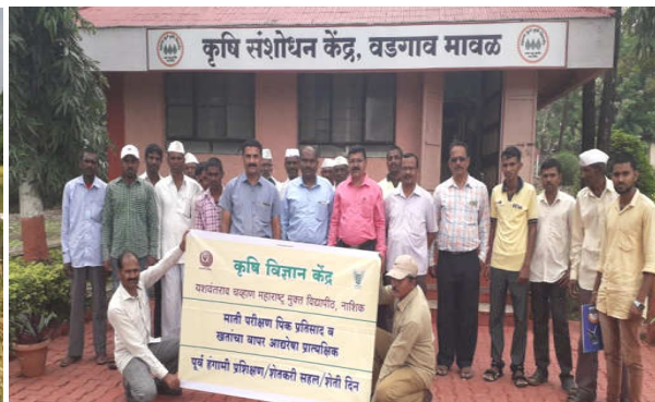
Left : Field day celebration on STCR Paddy at Jategaon (Bk), Traymbakeshwar Right : Exposure visit of PF at ARS, Wadgaon Maval, Pune