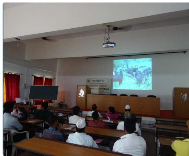
Left : Introduction of pure Osmanabadi goats in tribal village Right : Training of Tribal farmers for Goat rearing