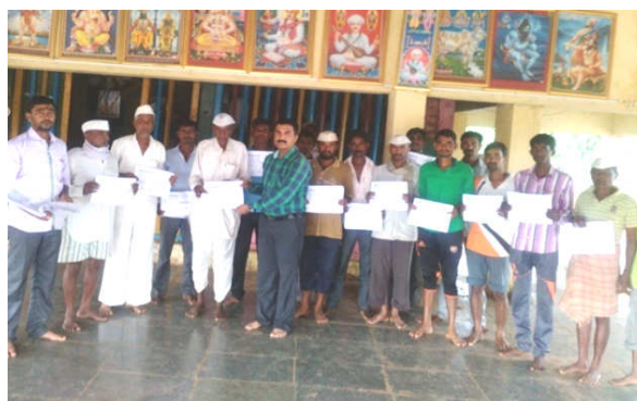
Left : Collection of soil samples at Jategaon (Bk), Traymbakeshwar Right : Soil Health Card distribution at Jategaon (Bk), Traymbakeshwar