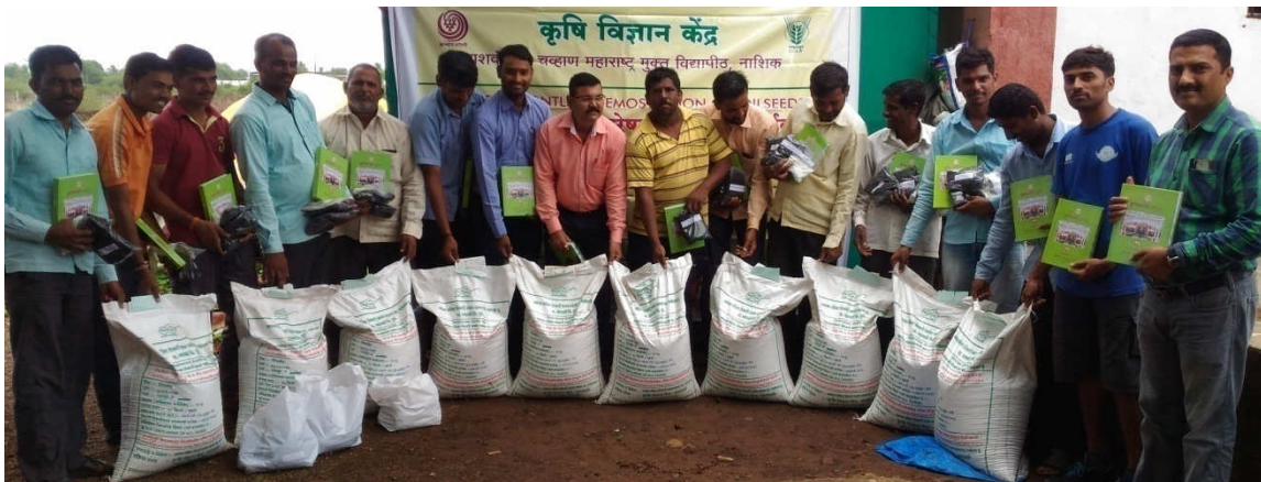
Critical inputs Seed and literature distribution of to soybean growers for CFLD in village Moh, Tal. Sinnar