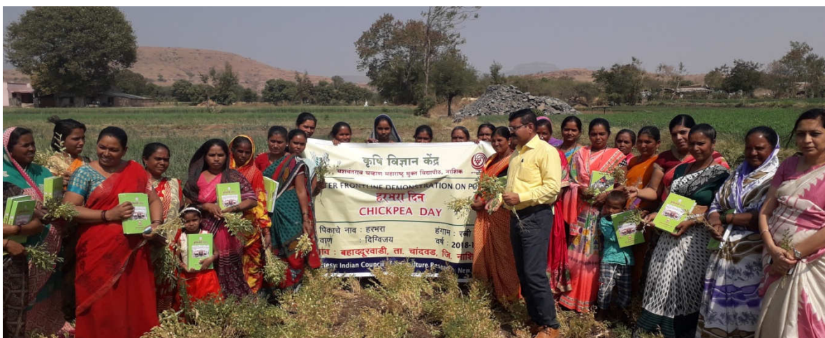
Celebration of field day of chickpea CFLD in village, Bahadurwadi Tal. Chandwad