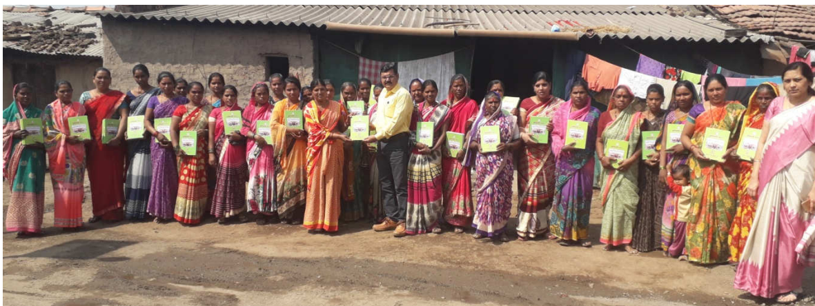
MPKV Krushi Darshani Agriculture informative literature for upscaling knowledge of Chickpea Growers under CFLD in village, Bahadurwadi Tal. Chandwad