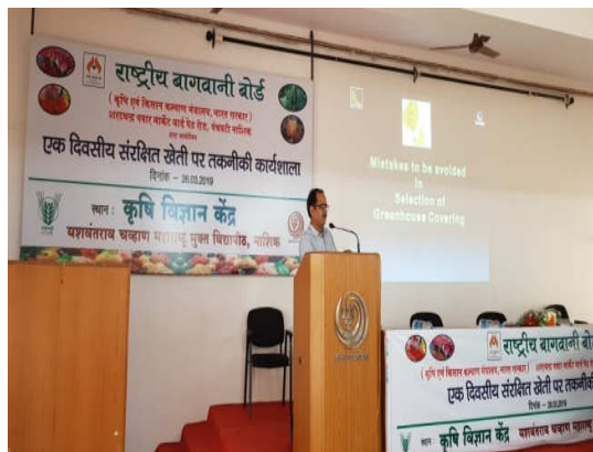
Left :Tribal farmers Training on increasing Productivity Right :Workshop on Protected cultivation of Horticultural Crops