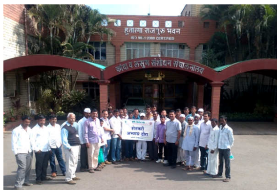
Left : Field day celebration on STCR Onion at Jategaon (Bk), Traymbakeshwar Right : Exposure visit of PF at CRS, Onion, Rajgurunagar, Pune