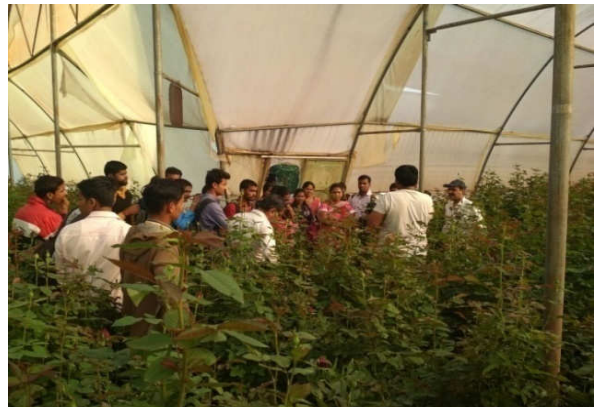
Left : Exposure visit High Density Mango Plantation Under TSP Village Chitapalli Right :Exposure visit of Rural Youths to protected cultivation of Roses at Village Mohadi