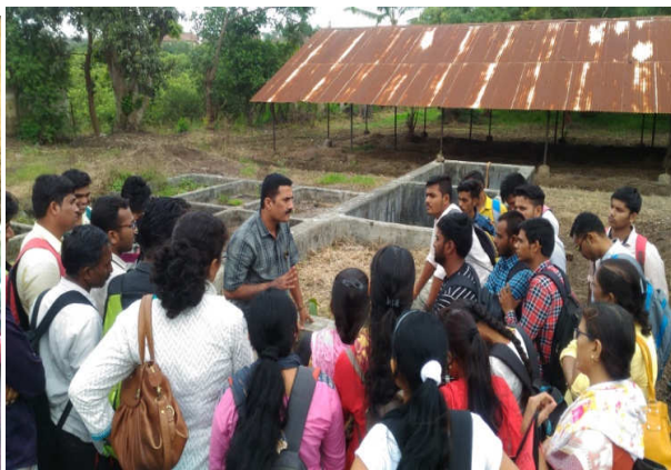
Left : Training on INM Finger Millet at Jategaon (Bk), Traymbakeshwar Right : Training on Soil and Water testing for Rural Youth at KVK campus