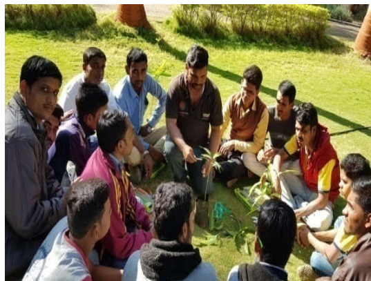
Left : Farmers Training on Opportunities in Fruit & Vegetable Processing Right :RY Training on Nursery Management Grafting Method Demonstration