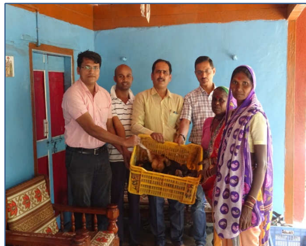
Left : Introduction of Improved desi breed of Poultry Giriraja in tribal village Right : Distribution of Giriraja birds in Front line demonstration program for tribals