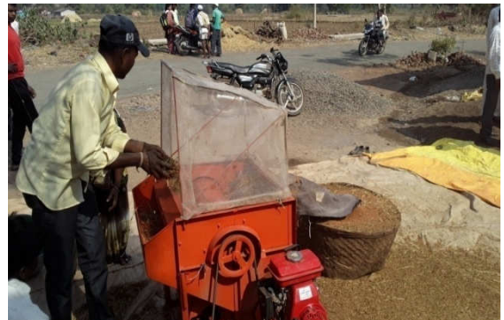
Right : Alternative use of mini thresher for finger millets in tribal area for marginal & small farmers at village chirapali Tal. Trimbakeshwar