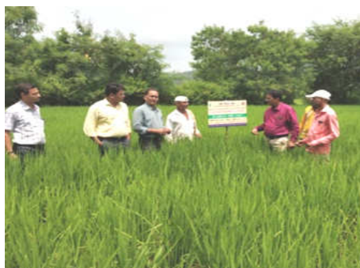
Left : STCR based fertilizer distribution at Jategaon (Bk), Traymbakeshwar Right : Monitoring STCR plot by Scientists at Jategaon (Bk), Traymbakeshwar