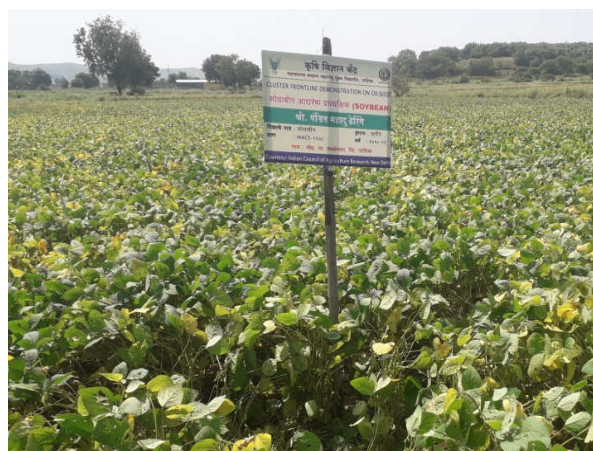
Left : Pod filling stage of Soybean demonstrated plot in village, Moh Tal. Sinnar Right : Pod development stage of Soybean demonstrated plot in village, Moh Tal. Sinnar