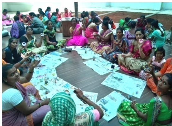
Left : Training conducted on seasonal local fruit Karoanda processing for farm women Right : Training conducted on Candle making for Self Help Group women