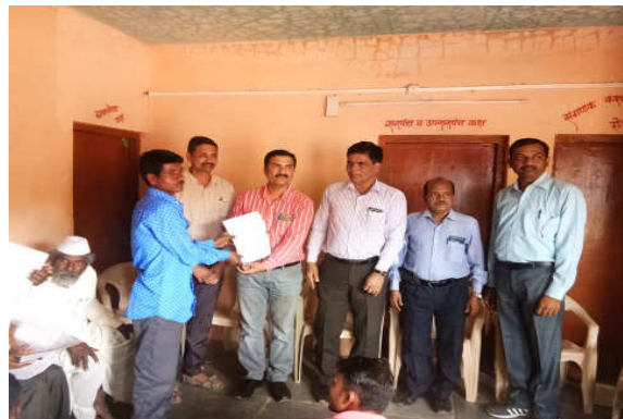
Left : Collection of soil samples at Jategaon (Bk), Traymbakeshwar Right : Soil Health Card distribution at Jategaon (Bk), Traymbakeshwar