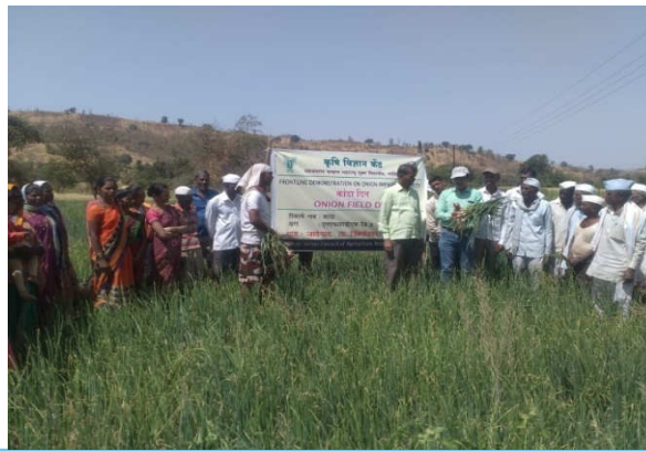
Left : FLD Onion Var. NHRDF Red-3 Seed distribution at Village Jategaon - Traymbakeshawar Right :FLD Onion Var. NHRDF Red-3 Field Day at Village Jategaon Tal - Traymbakeshawar