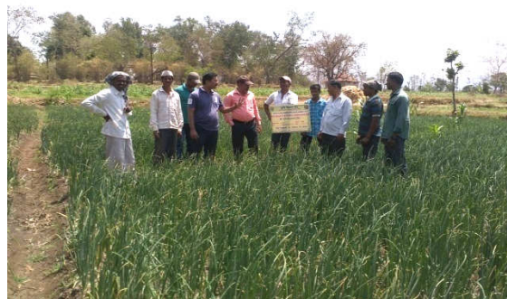
Left : STCR based fertilizer distribution at Jategaon (Bk), Traymbakeshwar Right : Monitoring STCR plot by Scientists at Jategaon (Bk), Traymbakeshwar