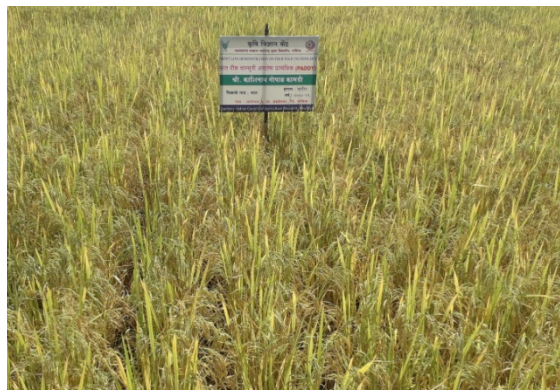
Left : Flowering stage FFT demonstrated paddy plot in village Jategaon, Tal. Trymbakeshwar Right : Milk stage FFT demonstrated paddy plot in village Jategaon, Tal. Trymbakeshwar