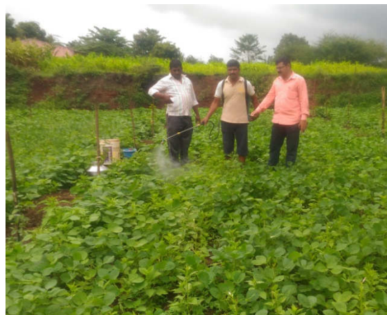
Left : Soil health card under CFLD in village, Moh Tal. Sinnar Right : Guiding about herbicide application for CFLD soybean plot in village, Moh Tal. Sinnar