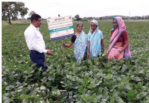
Left : Monitoring CFLD plots of Soybean by the scientists at Moh Tal. Sinnar Right : Monitoring CFLD plots of Soybean by the scientists at Moh Tal. Sinnar