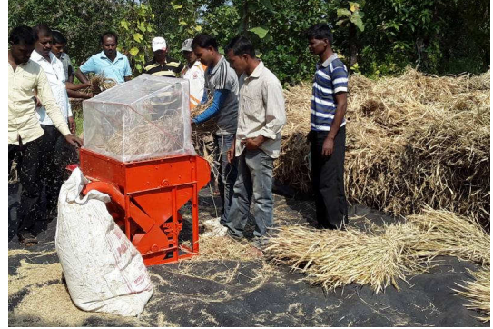
OFT on mini paddy thresher for small and marginal farmers at village chirapali Tal. Trimbakeshwar