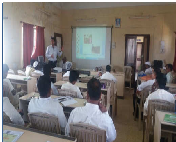
Left : On campus SHG training Program for increasing income potential through A.H. Right : Training for Extension functionaries