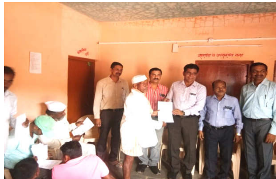
Left : Collection of soil samples at Jategaon (Bk), Traymbakeshwar Right : Soil Health Card distribution at Jategaon (Bk), Traymbakeshwar