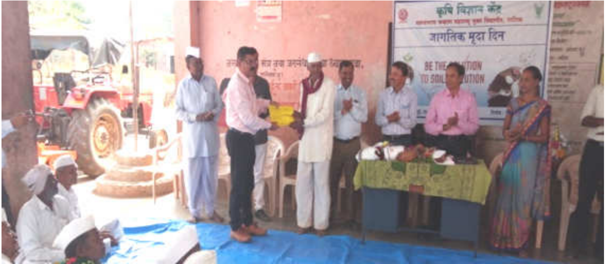
World Soil day : Soil Health Card Distribution at Jategaon (Bk), Traymbakeshwar