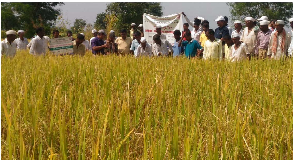
Field day celebration on Paddy FFT at Jategaon, Tal. Trambakeswar