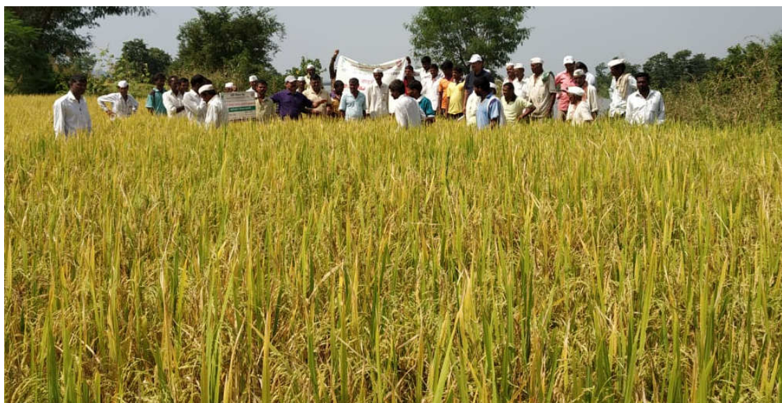
Celebration of field day on Paddy OFT var. Phule Samruddhi at Chirapali, Tal. Trymbakeshwar