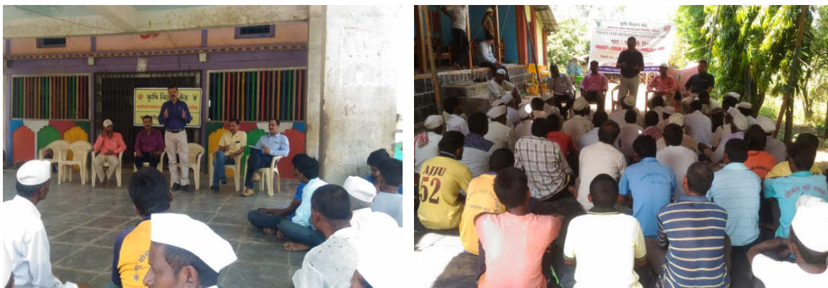
Left : Group discussion and selection of participants for demo of FFT paddy at Jategaon Right : Training on four fold technology of paddy at Jategaon, Tal. Trymbakeshwar