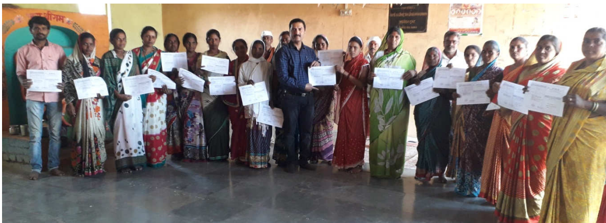
Soil Health Card of CFLD plots of chickpea distribution by scientists in village, Bahadurwadi T. Chandwad