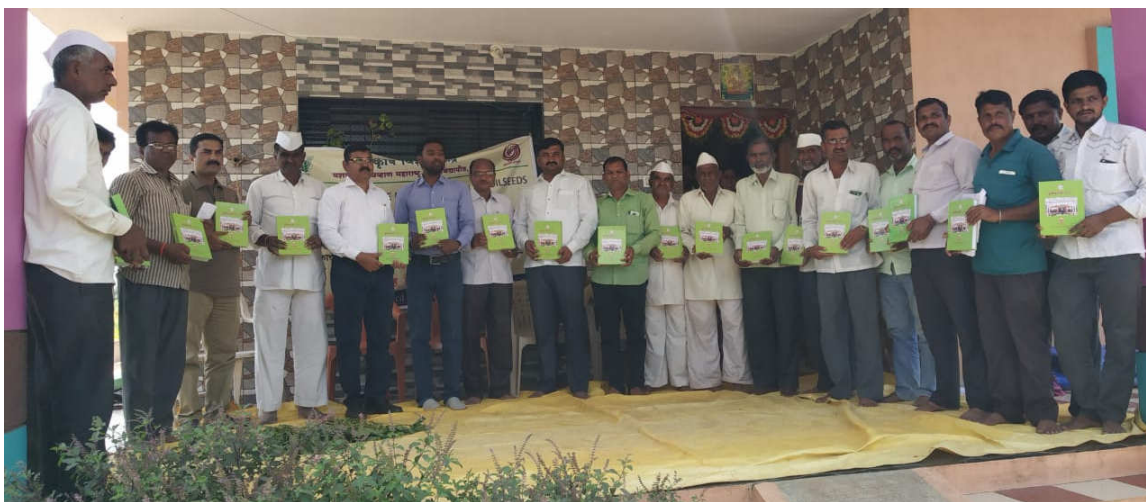
Distribution of literature Agriculture Diary to soybean growers in village Moh, Tal. Sinnar