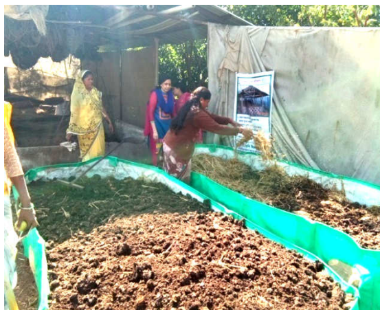
Left : Training with demonstration conducted on Mushroom cultivation for Rural Youth Right : Training conducted on Vermicompost for farm women