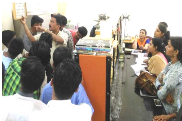
Left : Training on INM Onion at Jategaon (Bk), Traymbakeshwar Right : Training on Soil and Water testing for Rural Youth at KVK campus