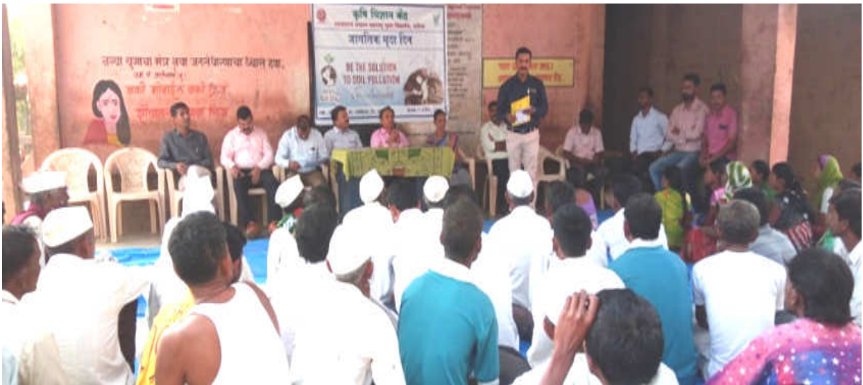
World Soil day : Awareness training on Soil Health Management at Jategaon (Bk), Traymbakeshwar