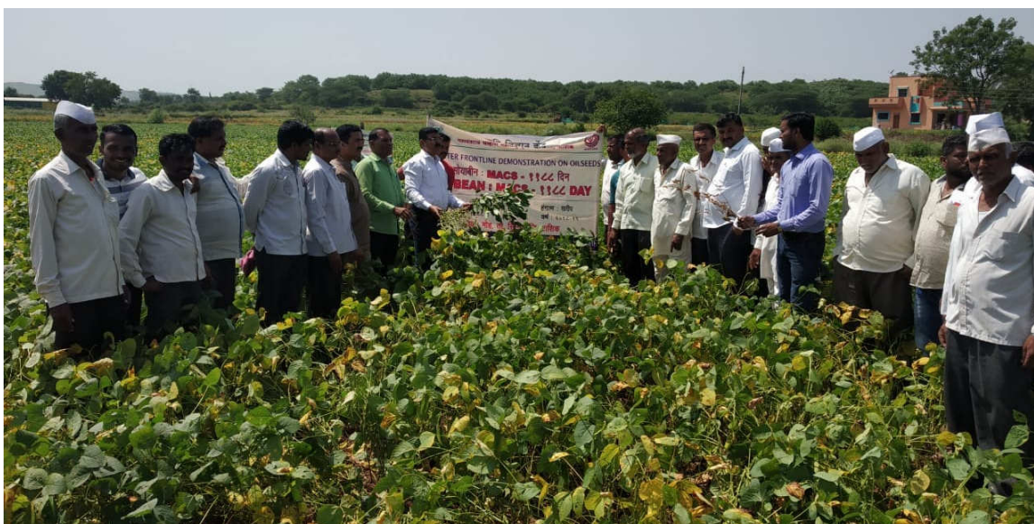
Celebration of field day of Soybean MACS-1188 varietal CFLD in village, Moh Tal. Sinnar