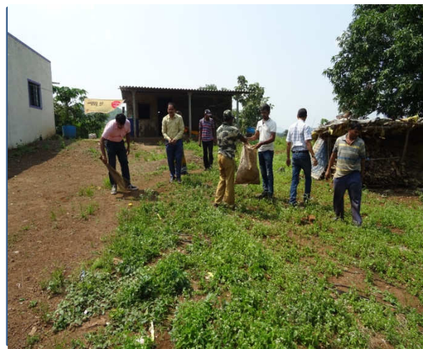
Left : Maintenance of chicks for demonstrations at KVK experimental farm