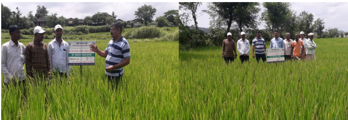
Left : Monitoring FLD plots of Paddy FFT by the scientists at Jategaon, Tal. Trymbakeshwar Right : Monitoring FLD plots of Paddy FFT by the scientists at Jategaon, Tal. Trymbakeshwar