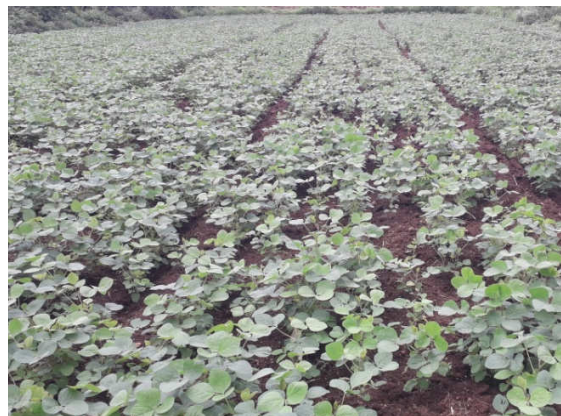
Left : Germination stage of Soybean demonstrated plot in village, Moh Tal. Sinnar Right : Branching stage of Soybean demonstrated plot in village, Moh Tal. Sinnar