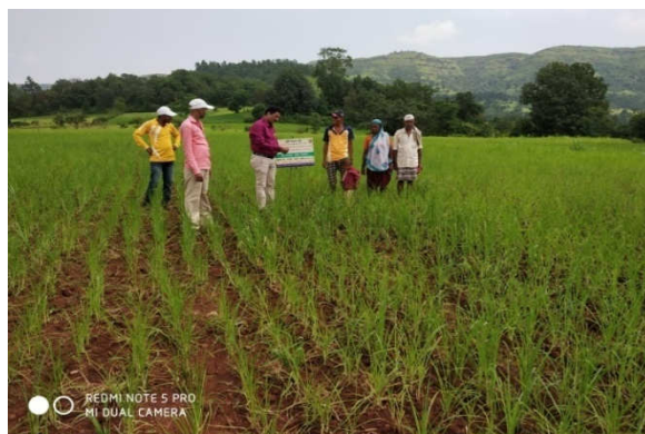
Left : STCR based fertilizer distribution at Jategaon (Bk), Traymbakeshwar Right : Monitoring STCR plot by Scientists at Jategaon (Bk), Traymbakeshwar