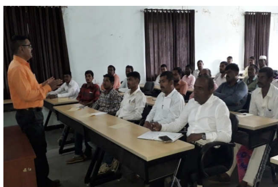
Left : On campus Training of Soybean Production Technology conducted for soya growers Right : Training of Soybean Production Technology for Extension functionaries at RAMETI