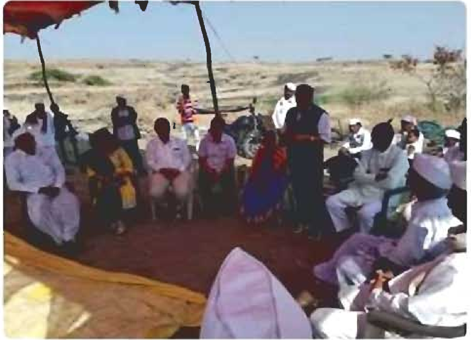
पोपेरेवाडी येथे बिजमाता राहीबाई पोपेरे यांच्या समवेत