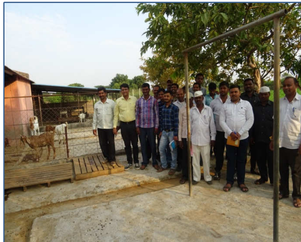
Left : Training of SHGs for poultry rearing at KVK experimental farm Right : Rural youths study tour at commercial goat farms