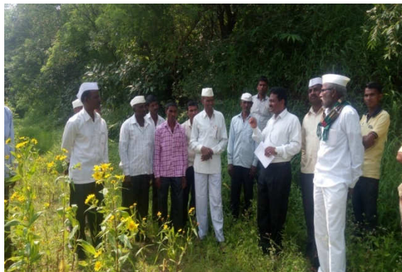
Left : Field day celebration on STCR Finger Millet at Jategaon (Bk), Traymbakeshwar Right : Exposure visit of PF at ZARC, Igatpuri