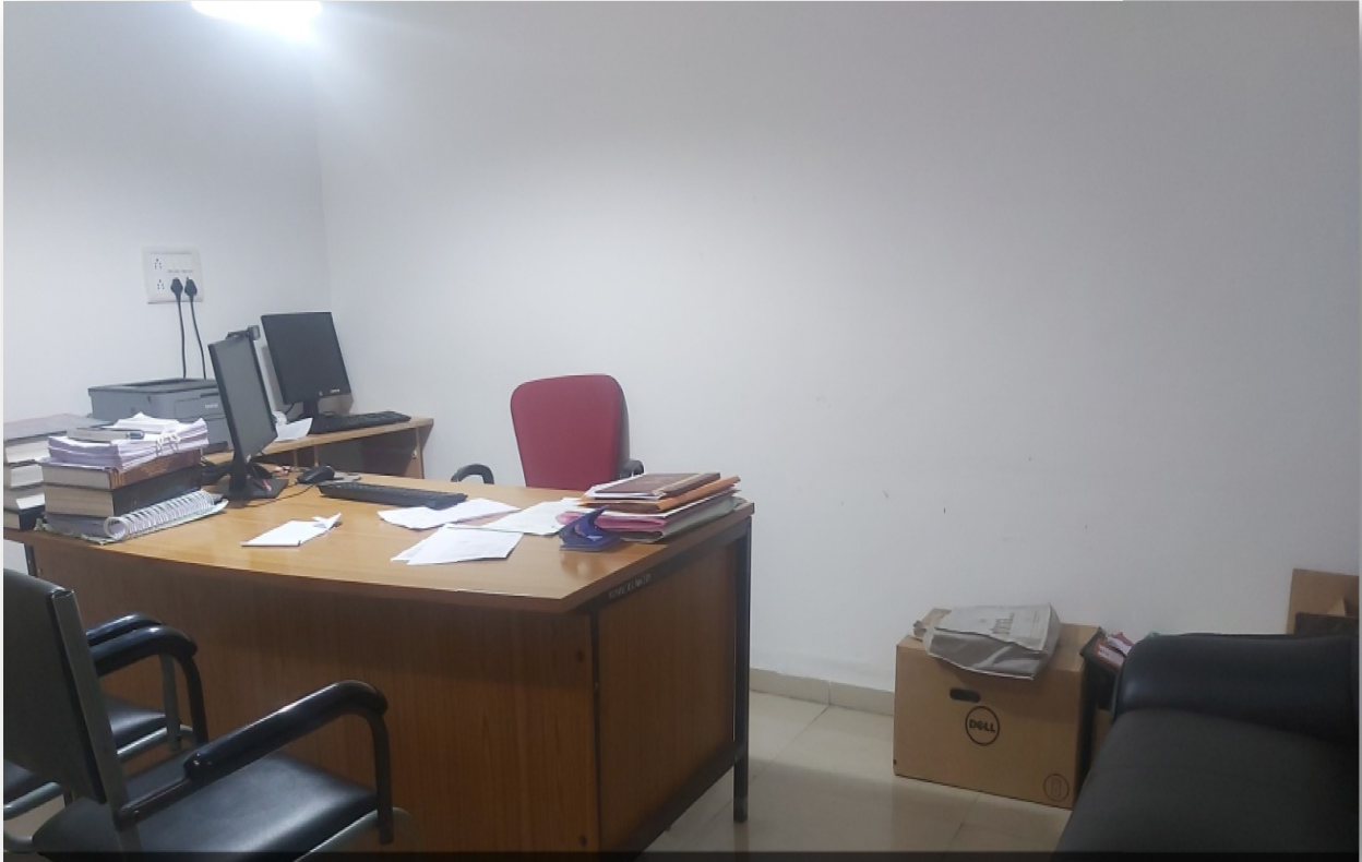
ASSISTANT REGISTRAR ROOM