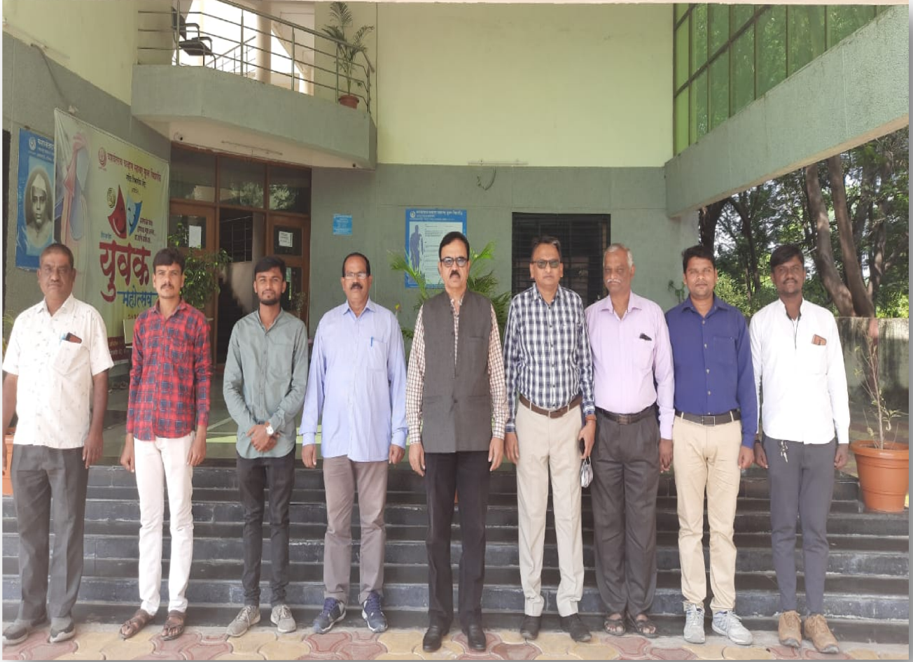
NANDED RC STAFF