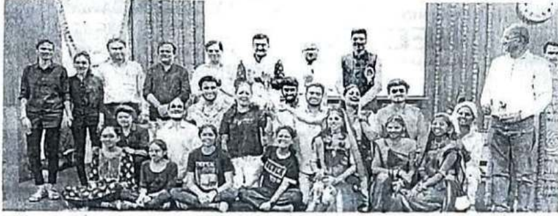
नाशिक : यशवंतराव चव्हाण महाराष्ट्र मुक्त विद्यापीठातर्फे झालेल्या केंद्रीय युवक महोत्सवात शुक्रवारी बक्षीस विजेत्या विद्यार्थ्यांचा सुरु असलेला जल्लोष.