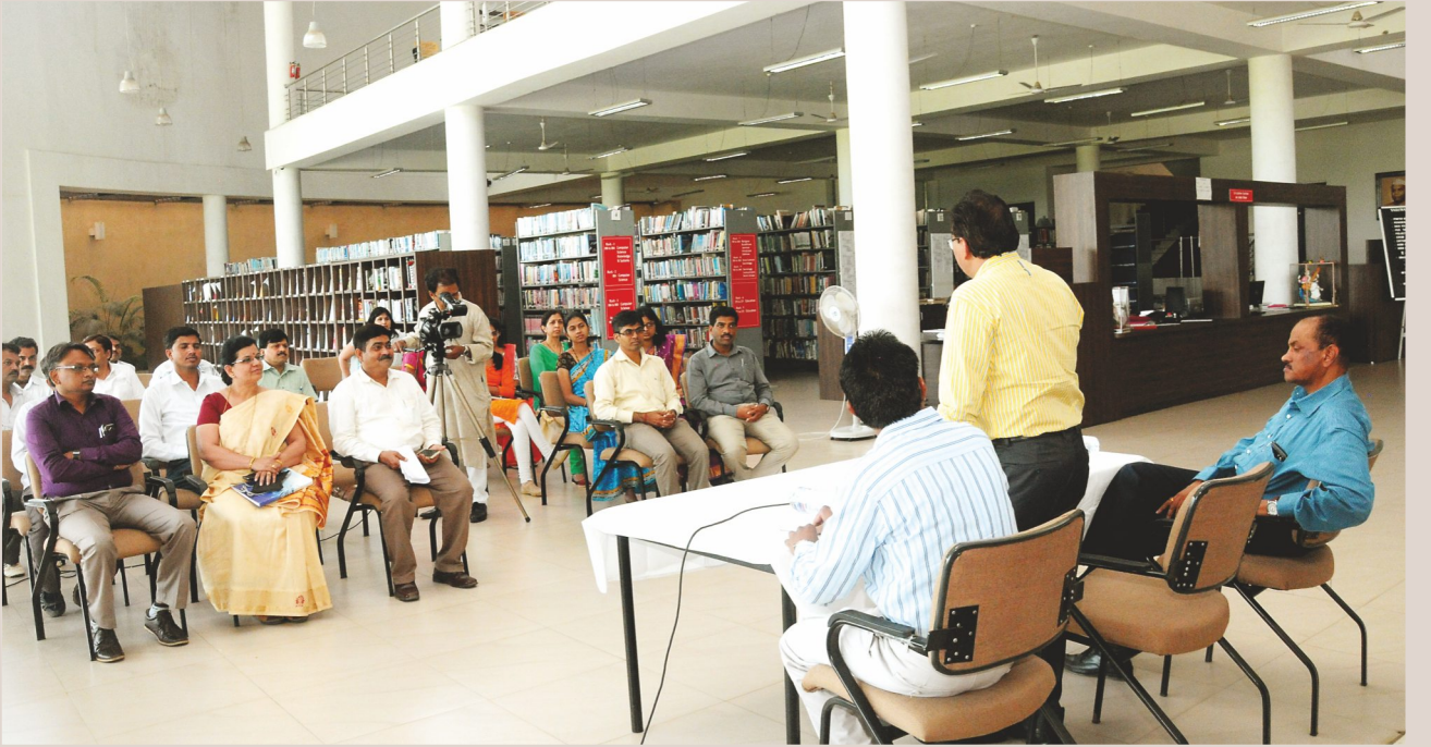
पुस्तक प्रदर्शन उद्घाटन कार्यक्रमास उपस्थित विद्यापीठातील अधिकारी, कर्मचारी.