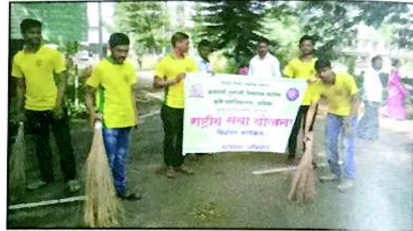
१५. 'स्वच्छता हीच सेवा' अभियानांतर्गत विद्यापीठ परिसर स्वच्छता कार्यक्रम, य.च.म. मुक्त विद्यापीठ, नाशिक