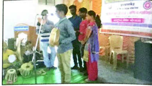
१४. व्यसनमुक्तीसंदर्भात गीतगायनाचा कार्यक्रम र. भ. अट्टल महाविद्यालय, गेवराई, जि. बीड