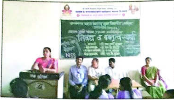
११. निबंध/ वक्तुत्व स्पर्धेचे आयोजन, पद्मभूषण डॉ. वसंतरावदादा पाटील महाविद्यालय, तासगाव, जि. सांगली