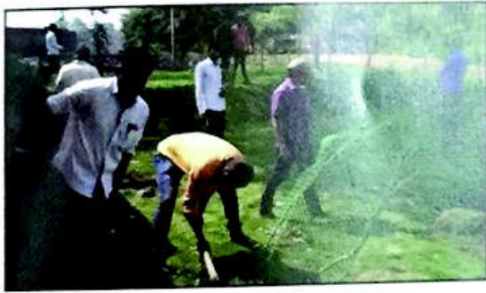
१७.१ वृक्षारोपण, कर्मवीर भाऊसाहेब पाटील महाविद्यालय, उरुण, इस्लामपूर, जि. सांगली