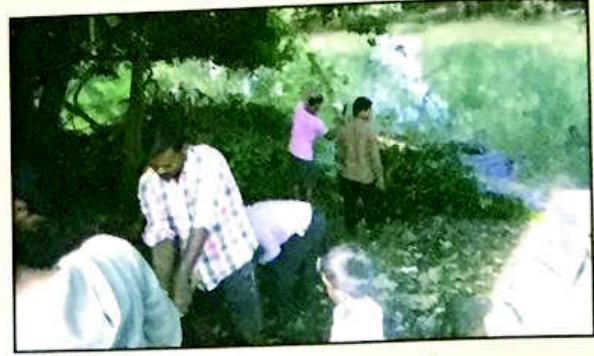
१९. जल-स्रोतांची स्वच्छता, सहाद्री क. महाविद्यालय, धामोड, जि. कोल्हापूर