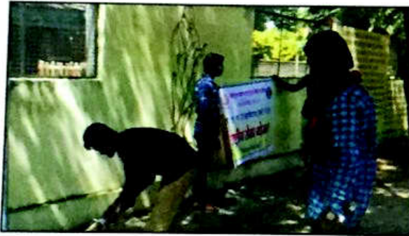
१३. 'अहिंसा' या विषयावर व्याख्यान, सोनोपंत दांडेकर महाविद्यालय पालघर, जि. पालघर