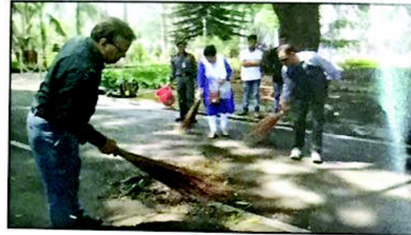
१५.२ 'स्वच्छता हीच सेवा' अभियानांतर्गत विद्यापीठ परिसर स्वच्छता कार्यक्रम, य.च.म. मुक्त विद्यापीठ, नाशिक