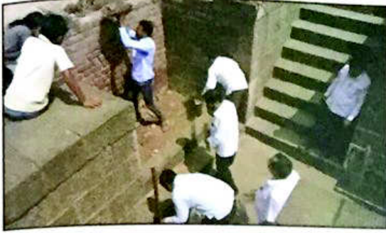
१६. गड-किल्ले संबर्धन व स्वच्छता, आनंदराव धोंडे ऊर्फ बाबाजी महाविद्यालय, कडा, जि. बीड