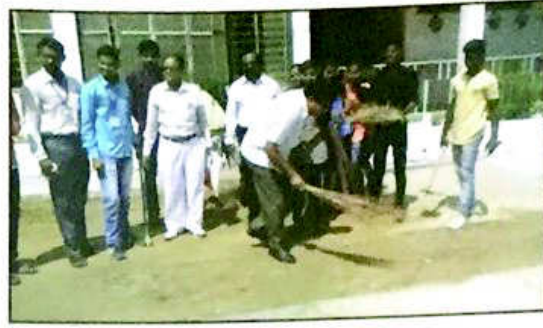
१८. महाविद्यालय परिसर स्वच्छता, एन वाय एन बत्ताण महाविद्यालय, चाळीसगाव, जि. जळगाव