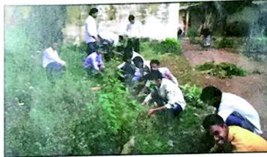
१८.१ महाविद्यालय परिसर स्वच्छता, कॉम. गोदावरी शामराव परुळेकर महाविद्यालय, तलासरी, ता. डहाणू, जि. ठाणे