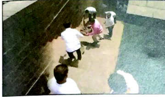
१७. परिसर स्वच्छता व वृक्षारोपण, कर्मवीर भाऊसाहेब पाटील महाविद्यालय, उरुण, इस्लामपूर, जि. सांगली