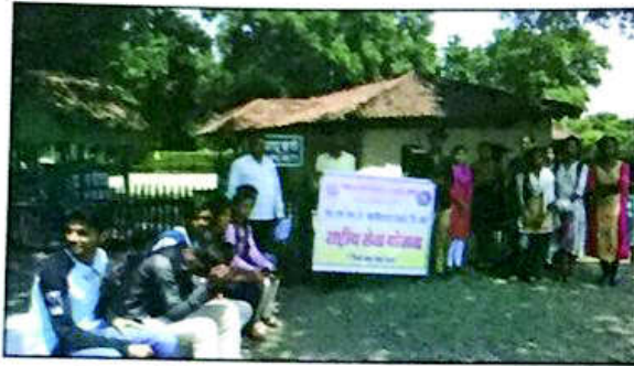
१२. सेवाग्राम येथे 'स्वच्छता हीच सेवा' अभियानांतर्गत कार्यक्रमाचे आयोजन, एस.एस.एन.जे. महाविद्यालय, देवळी