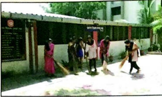
१८.२ श्रमदान कार्यक्रम : किसनवीर महाविद्यालय, चाई, जि. सातारा